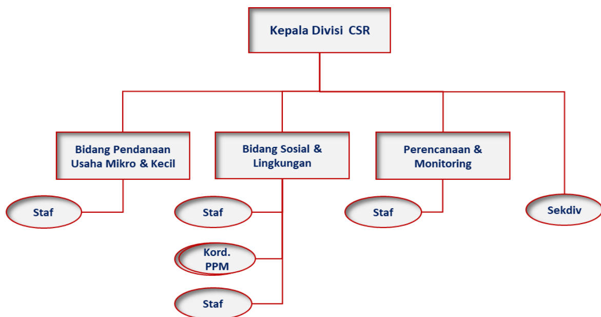
Bagan Struktur Organisasi Pengelola Program Tanggung Jawab Sosial dan Lingkungan PT TIMAH Tbk

Pada dasarnya, keberhasilan program TJSL TIMAH menjadi tanggung jawab seluruh Insan TIMAH dengan penanggung jawab utama berada pada Direktur Utama. Adapun tugas Divisi CSR adalah untuk melaksanakan perencanaan, pengembangan dan implementasi program Tanggung Jawab Sosial dan Lingkungan Perusahaan yang meliputi: