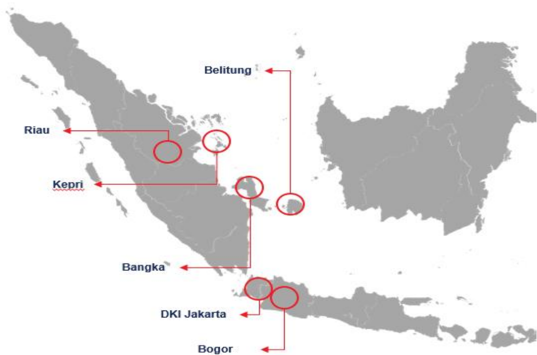
Peta Penyaluran Dana TJSL Tahun 2023

Penyaluran Dana TJSL meliputi Provinsi Bangka Belitung, Povinsi Kepulauan Riau, Provinsi Riau, DKI Jakarta dan Provinsi Jawa Barat.